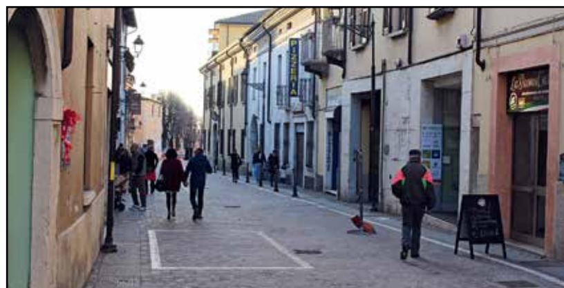
Una passeggiata in Centro. Ideale senza macchine?