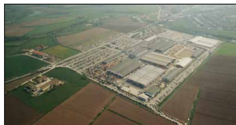
Fiera Agricola del 1991 l'anno della svolta. Un risultato economico, grazie all'ampliamento dei settori espositivi, che ha consentito la scelta, risultata vincente, della ricostruzione e realizzazione di nuovi padiglioni con una media di un intervento all'anno. Investimenti totalmente sostenuti dal Centro Fiera Spa, con relativi mutui, unitamente al versamento al comune di Montichiari di svariati milioni sotto forma di affitto.

EUROPEA IMMOBILIARE MONTICHIARI (BS) - Piazza S. Maria, 1 Tel./Fax 030.9962606 - Cell. 334.5889444 - europeamontichiari@libero.it