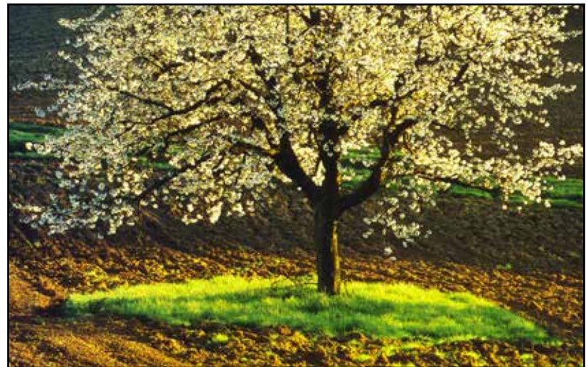
Ciliegio in fiore.