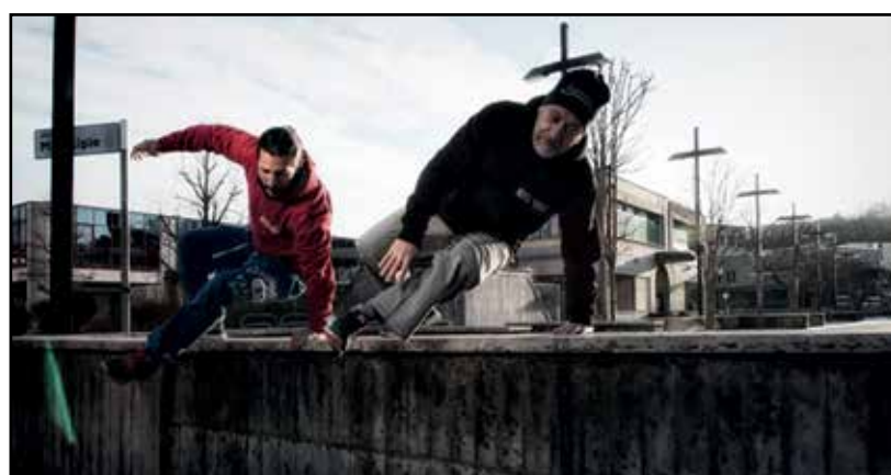
Un passaggio plastico.

Una strada nuova, verso la serenità, tra sacrifici e gioie. Non è una strada facile, lo so, ed è per