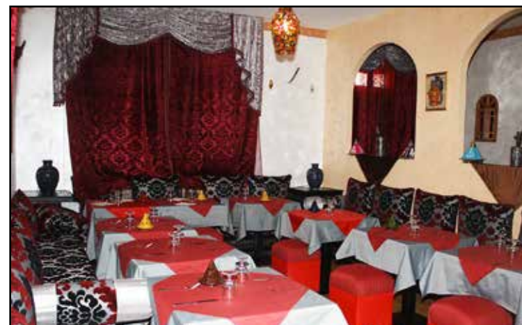
LA SECONDA SALA RISTORANTE

CUCINA ANCHE PER VEGETARIANI E VEGANI CON DOLCI SIRIANI