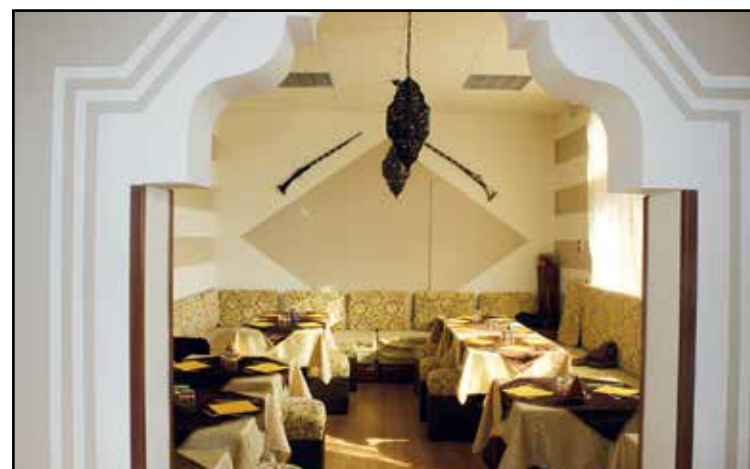
LA PRIMA SALA RISTORANTE

MENU' ALLA CARTA PIATTI DELLA CUCINA SIRIANA